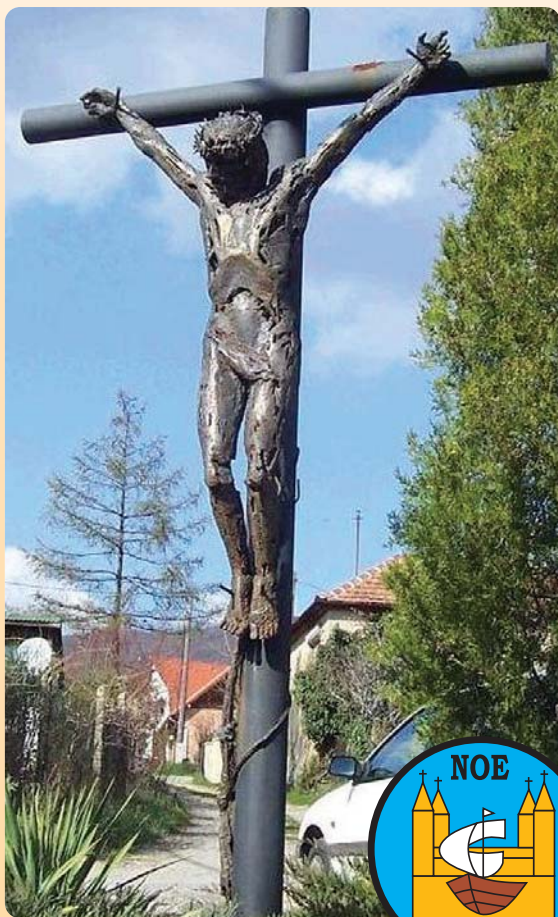
Vasfeszület Pécs